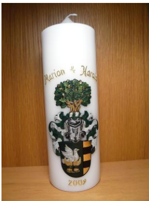
Das Sarfert Wappen. Als Relief schmückt es hier eine Kerze.